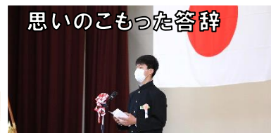
思いのこもった答辞