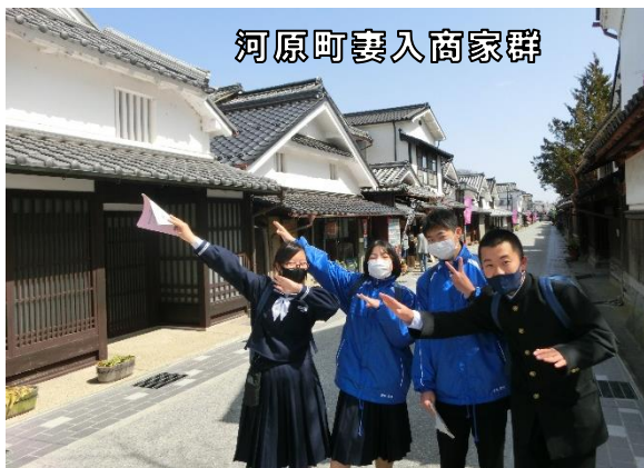
河原町裏入商家群

2年生が丹波篠山で校外学習を行いました。次年度の修学旅行の班別行動に向けた練習として、班ごとに自分たちで計画したコースを回りました。チェックポイントを巡り、班で協力し合い、一人ひとりが自覚ある行動をとることができました。この班別行動を通して、集団行動や班行動のルールやマナー、計画や事前調査の大切さなど、学ぶことが多く、修学旅行のよいリハーサルができました。3年生を送る会、卒業式、そして今回の校外学習を経て、今後さらに東中のリーダーとして、大きく成長してくれることを期待しています。