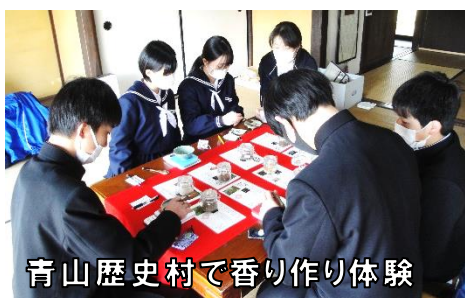
青山歴史村で香り作り体験