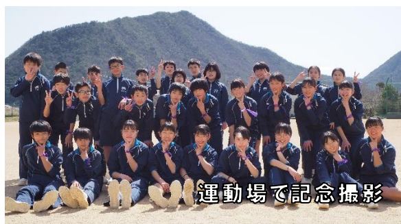
運動場で記念撮影