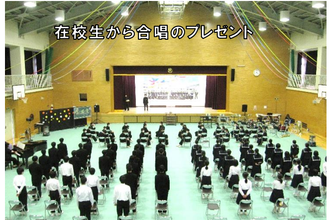
在校生から合唱のプレゼント

3月15日(月)に3年生を送る会を開催しました。アンケート結果の発表、クイズ、在校生とお世話になった先生方からのビデオレター、3年生タイム、3年間の映像など、本当にたくさんのプログラムで3年生を楽しませてくれました。フィナーレでは在校生で作った巨大なモザイクアートとポップアップメッセージカード、合唱「旅立ちの日に」が卒業生に贈られました。生徒会役員を中心に2月はじめから準備を進めてきたこのプロジェクトは、在校生、卒業生どちらにとっても笑いあり、涙ありの忘れられないものとなりました。