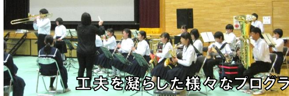
工夫を凝らした様々なプログラム・・・ありがとう！