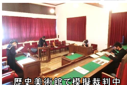
歴史美術館で模擬裁判中