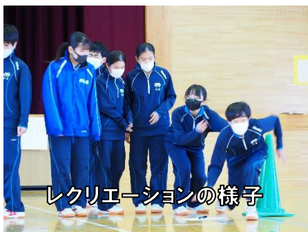
レクリエーションの様子