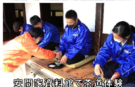
安間家資料館で茶道体験