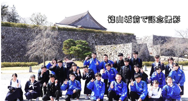
篠山城前で記念撮影