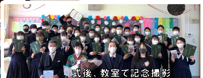
式後、教室で記念撮影