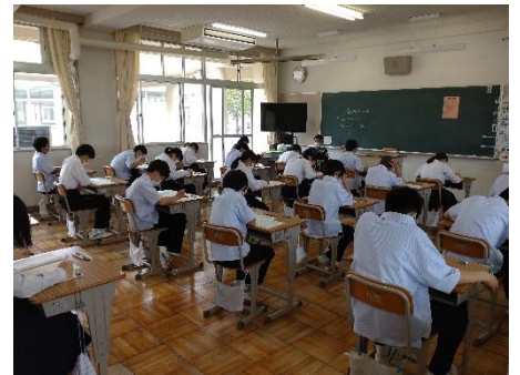
中学校で初めての定期テスト、緊張しました。

5月25日(水)、26日(木)に、中間テストを実施しました。1年生にとっては、中学校生活最初の定期テスト。緊張しながらテスト開始を待ち、全力で行き組みました。結果は数日後に本人に返却されましたが、予想通りだった、思ったように力を出せなかったなど、さまざまな思いとともに結果を受け止めたようです。2、3年生は、落ち着いてテストを受けていました。特に3年生は、受験生として自覚をもって学習に取り組んでいる人が多いようです。次回は、6月29日(水)から3日間の期末テストがあります。