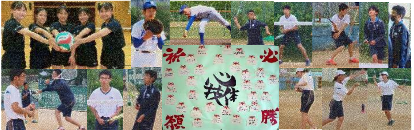
気合十分。練習も大詰めです。応援、よろしくお願いいたします！