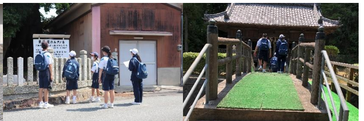
班ごとに分かれて、比延地区のいろいろな場所をめぐるしました。