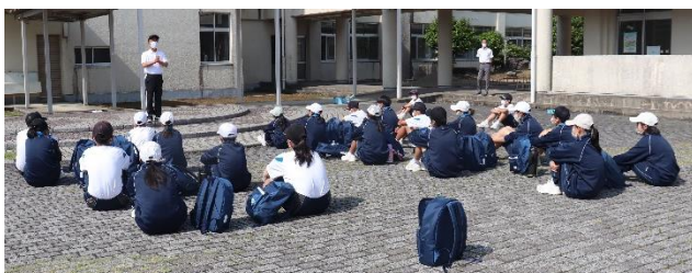
当日の朝、元気に集合しました。