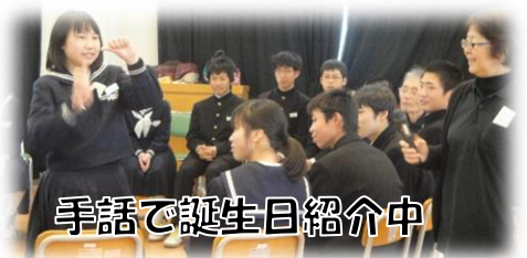
手話で誕生日紹介中

2月15日(金)に1年生と2年生が西脇市手話サークル「わかば」と西脇市聴覚障害者協会のみなさんにお世話になり手話体験学習を実施しました。耳の聞こえない方の実体験を聞いた後、聴覚障害に関するクイズや手話学習をしていただきました。短い時間でしたがいくつかの手話を覚え、お互