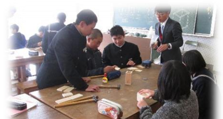
丁寧に教える先輩たち

2月1日(金)に小学6年生が中学校で体験入学を行いました。今年度も2年生が中心となり、東中の魅力を紹介しました。体験授業は緊張した面持ちで始まりましたが、2年生が先輩としてしっかりとリードしてくれたため、授業が進むにつれてとても楽しくしている様子が見られました。また生徒会役員からの説明や、部活動見学も行いました。2時間ほどの体験入学でしたが、東中学校の魅力や校風、雰囲気十分に伝わったのではないかと思います。