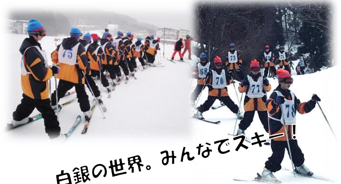
白銀の世界。みんなでスキー！

1月25日(金)、26日(土)の1泊2日の日程で、1年生が八チ高原スキー場で冬季野外活動を実施しました。西脇では見られない雪の中、1泊2日を有意義に過ごすことができました。スキーの楽しさを味わい、仲間との思い出をつくるとともに、よりよい集団生活のあり方や行動の仕方について学習する機会となりました。