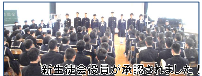
新生徒会役員が承認されました！

1月30日(水)、平成30年度の第2回生徒総会が実施され、企画委員会及び各部部長から、本年度の活動報告を行いました。5月の第1回生徒総会とは少し違い、役員一人一人から自分たちの仕事をやり遂げてきたという自信と達成感が伝わってきました。また、選挙で選ばれた2年生の新社長によって指名された7名の専門部長が拍手で承認され、生徒会本部役員10名が正式に決定しました。その後、30年度役員から役員バッジが手渡され、生徒会活動が2年生へと引き継がれました。そして、バトンを受け継いだ新役員10名が最初のあいさつを行いました。その言葉からは、生徒会を託された責任の重さを感じつつも、自分たちでこれからの生徒会をつくりあげようという意気込みが感じられました。