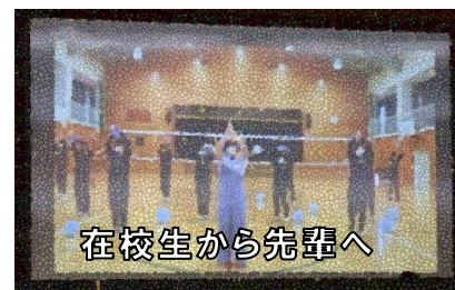
在校生から先輩へ