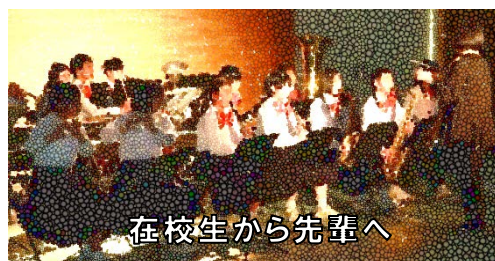
在校生から先輩へ