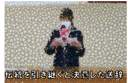
伝統を引き継ぐと決意した送辞