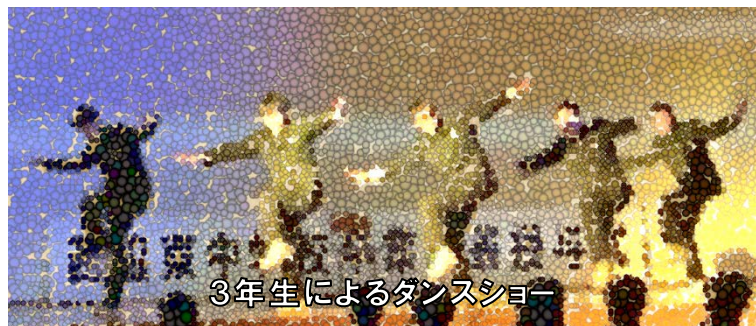
3年生によるダンスショー