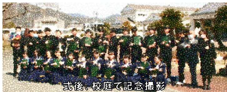
式後、校庭で記念撮影