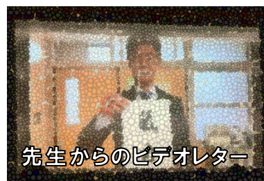
先生からのビデオレター