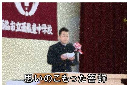
思いのこもった答辞