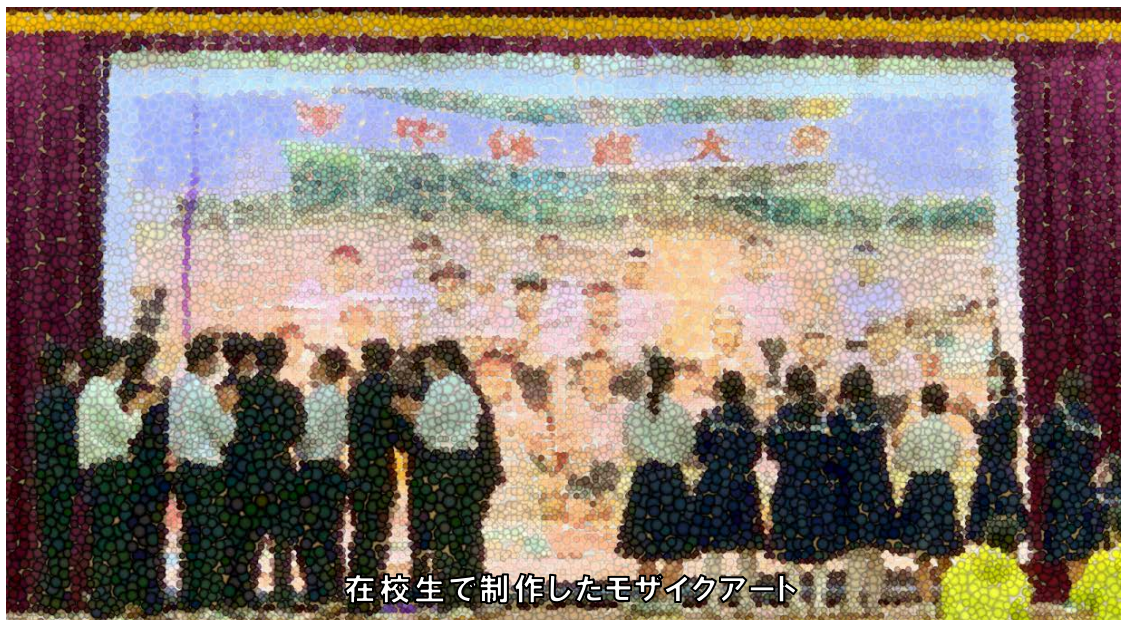
在校生で制作したモザイクアート