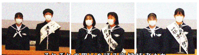
それぞれの思いを語る立候補者たち

となりました。次期生徒会の中心として、西脇東中学校をよりよい方向に引っ張っていってくれることを期待しています。