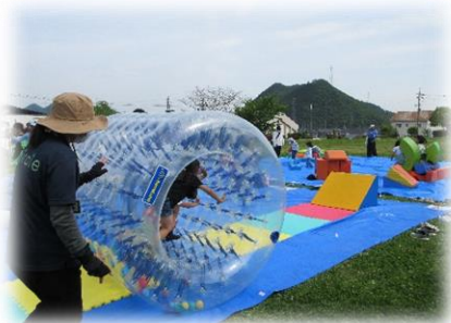
サイバーホイール、上手に動かしています。

5月2日(土)に開催した、「あそびのマルシェ」には、151人の親子が参加されました。大型エア遊具でおもいきり身体を動かしたり、簡単な工作にチャレンジしたり…。最後のお楽しみは、宝探しゲーム！最後の勇者は！！ゴールデンウィーク初日を、ご家族皆さんで楽しまれました。参加して下さった皆さん、ありがとうございました。