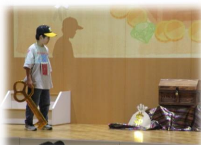
勇者に決まったお友だちが、宝箱の鍵を開けると…