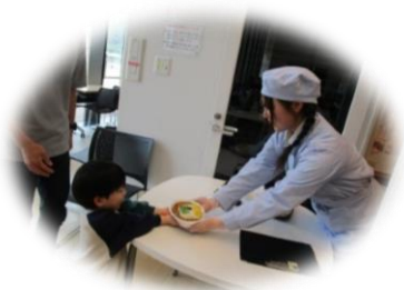
西脇高校生活情報科の生徒さん特製カレー！！「とっても美味しい！」と大好評！朝から準備に調理、ありがとうございました。