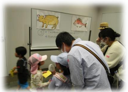
メインイベント！宝探し。クイズに挑戦し、宝を探します。