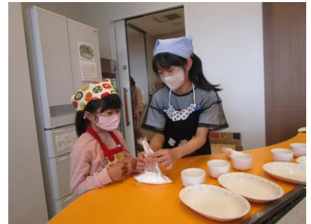
感想用紙【保護者用】

クッキングは、久しぶりにやってみると、楽しかったです。♪やっぱり自分で作ったからおいしかったです。こどもは、ホットケーキを作りたいです!! !ありがとうございました!