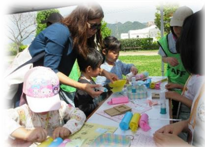
季節の工作ブース！こいのぼり作りに挑戦。