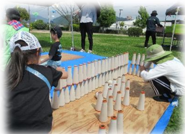
紙管積みチャレンジ！どこまで積めるかな？