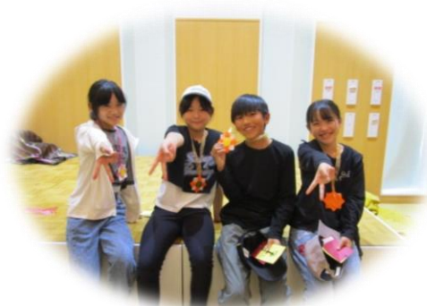
宝箱に入っていたのは金のメダル！参加者みんなに、プレゼント！