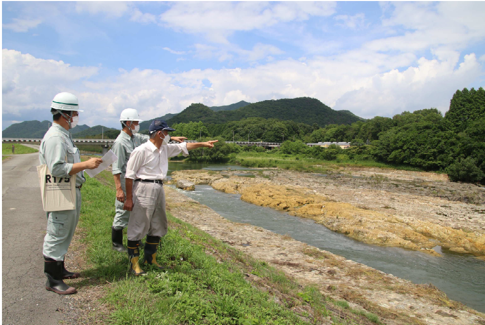
地元役員と行政職員による整備状況の確認（加古川・西脇市津万地区）