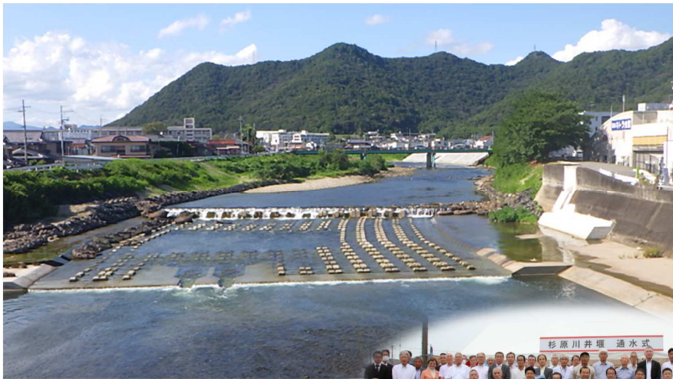
沖田・和田井堰の完成（杉原川・西脇市西脇周辺）