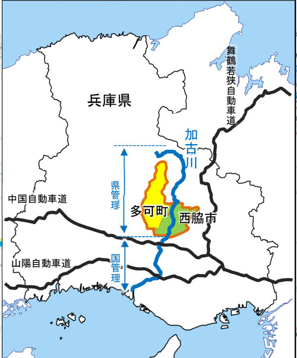
(西) 加古川 河床掘削 (西脇市津万～黒田庄地区)