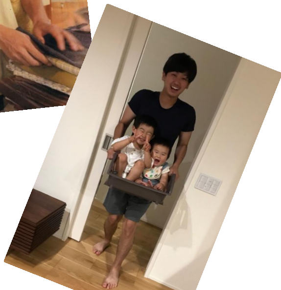
掲載している写真は2022(令和4)年度受賞作品です。