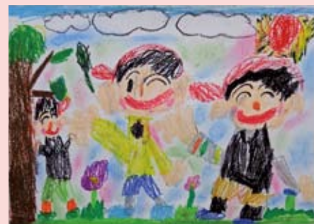
重春小学校 東口 歩夢