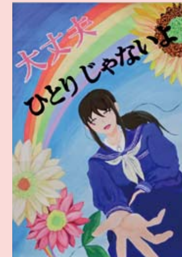
西脇南中学校 大地 みう