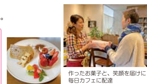
作ったお菓子と、笑顔を届けに毎日カフェに配達

「近づく努力をしながら夢を追い続けてほしい」年齢は関係ないので焦らなくてもいいですよ。子育て中でもあきらめずに勉強していくこと、「今しかない」という思い切りが大切です。