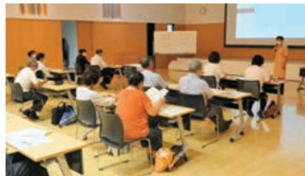
9/4 企業セミナー（ハラスメント対策） 市内事業者等 約20人が参加

大企業は2020（令和2）年6月から、中小企業は2022（令和4）年4月からスタートします。人権教育企業セミナーの中でハラスメントとは何か、ルールづくりや相談窓口の体制整備等について学びました。