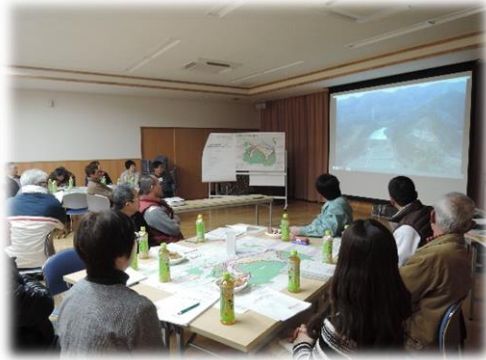
(まちづくり協議会全体の様子)

第2回まちづくり協議会の「まちづくり構想図(素案)」から「生活利便施設エリア」や「住民憩いの場」、「コミュニティの拠点」等が追加されました。