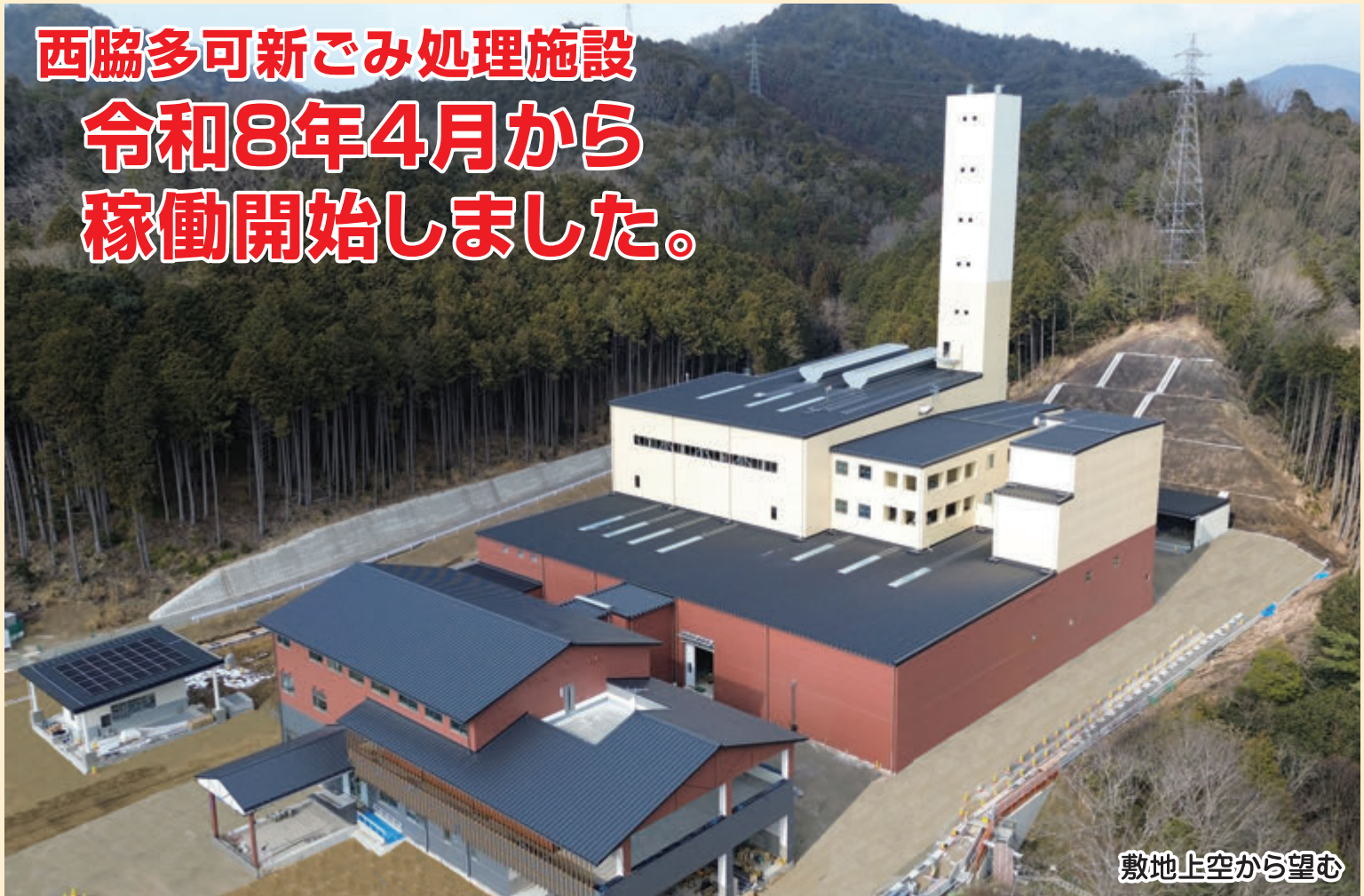
敷地上空から望む