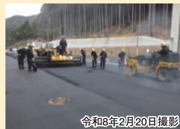
通路部舗装の施工