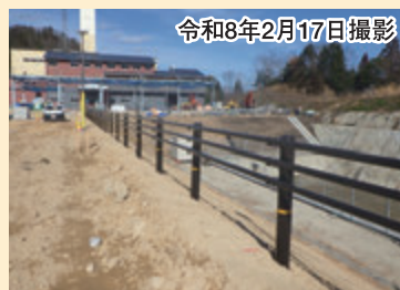
駐車場内防護柵の施工