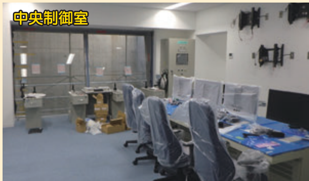
機器のセットアップを行っています