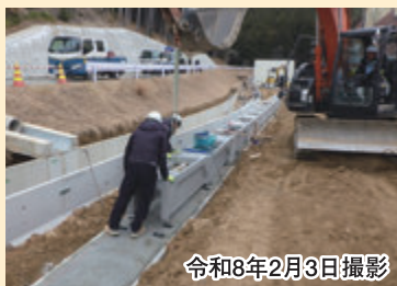
施設内側溝の据付