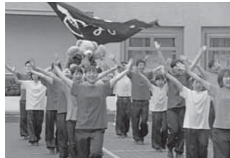
▲地元のダンスグループ・あまのじゃくがダンスでお祝い