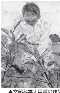
▲文部科学大臣賞の作品