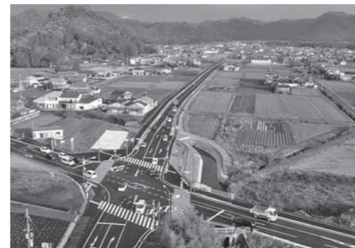
開通した日野北バイパス

この道路の開通により、多可町と西脇市との交流や連携がより活発になることが期待されています。