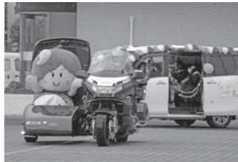
▲公用車を飾りつけし、婚姻届を出される2人をお迎え