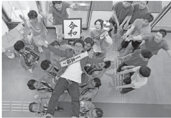
▲胴上げ隊が胴上げで祝福！掛け声は「れいわ！」

5月1日、「令和」元年がスタートしました。 多可町では、職員の有志グループ「TEAMたかまる」が主催する改元記念イベント『WELCOME令和！愛がたかまるスペシャルハッピーデー♡in多可町』を開催。役場本庁舎を会場に、婚姻届、出生届を提出される人を、さまざまな演出で祝いました。 この日、多可町に届け出のあった婚姻届は11組、出生届は4件でした。