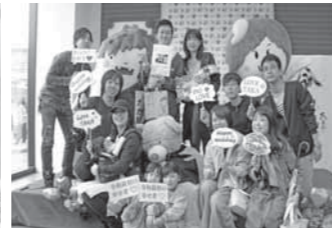
▲家族や友人もかけつけ、みんな2人の門出をお祝い