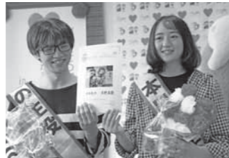
▲杉原紙で作ったオリジナルの受付票を記念に