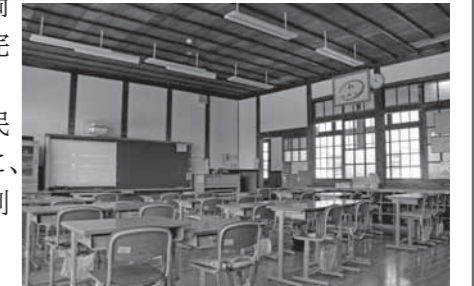
生まれ変わった教室

「子どもたちの安全の確保」と「文化財としての価値の保存」の両立を目指して完成した校舎は、これからも市民の思いとともに、新たな歴史を刻んでいきます。