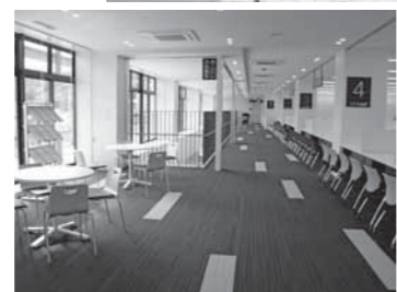
▲南側をガラス張りし、外光が差し込む明るいフロア