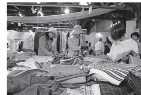
来場者でにぎわう播州織工房

播博は「織物のまちに、織物の名物市を」を合言葉で開催された「播州織の生地マルシェ」で、播州織企業が空き店舗などで生地を販売したほか、学生によるリース作りやTシャツづくり体験などが催されました。