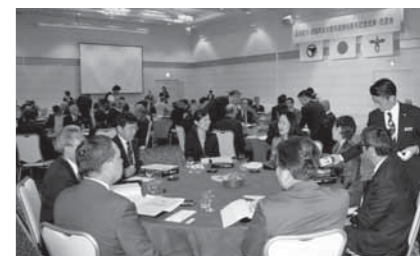
西脇ロイヤルホテルで式典・祝賀会を開催