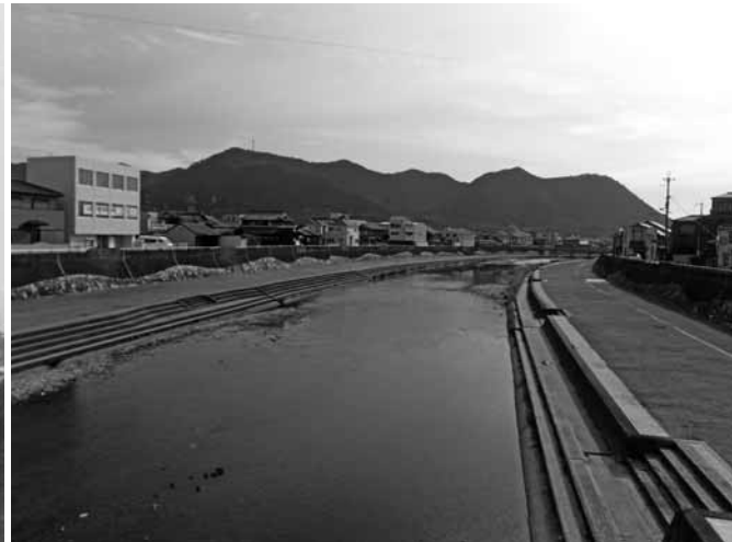
杉原川（蓬莱橋付近）の風景 （上）現在 （左）昭和5年頃