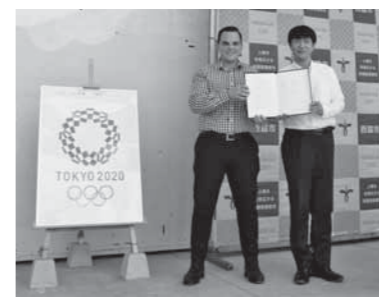
オーストラリア卓球協会のスコット・ヒューストンCEO(左)

2020東京オリンピック・パラリンピックの事前合宿地に決定したことから、オーストラリア卓球協会のスコット・ヒューストンCEOを西脇市にお迎えし、調印式を行いました。