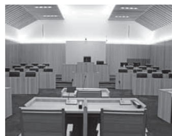
▲多可町産杉を随所に使用した議場 ▲杉原紙を使用したガラス壁面