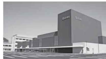
オープンした新庁舎・市民交流施設

「日本のへそ」西脇市のさらにもなから、人と人がつながる、地域と地域がつながる、暮らしが未来につながる「まんなかから、つながるまち」の実現を目指しています。