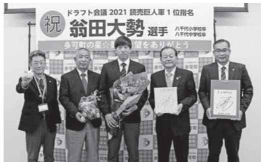
◀11月9日 多可町へ 表見訪問