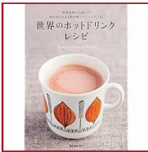
世界のホットドリンクレシピ 誠文堂新光社／編 (誠文堂新光社)

冬の風物詩のお鍋を定番からおもてなし品まで掲載。野菜や魚介類、肉、豆腐などいろいろな組み合わせと味付けで楽しみ、体を芯から温めよう。