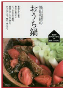
飛田和緒のおうち鍋 毎日食べたい充実の56レシピ 飛田和緒／著 (世界文化社)

冬の風物詩のお鍋を定番からおもてなし品まで掲載。野菜や魚介類、肉、豆腐などいろいろな組み合わせと味付けで楽しみ、体を芯から温めよう。