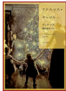
クリスマス・キャロル ディケンズ／著 越前敏弥／訳 (KADOKAWA)

言わずと知れた、ぐりとぐらのクリスマスの物語。おっきなおっきなクリスマスケーキに、大人も子どもも思わずわくわく、にっこりしてしまう。