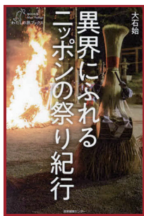
異界にふれるニッポンの祭り紀行 大石始/著 (産業編集センター)

「秋田のナマハゲ」の実物を見たことはないし「沖縄のパーントゥ」に泥だらけされたこともない。非日常の全国18カ所の祭りを取材した一冊。