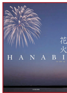
花火 冨木一馬/写真 (光村推古書院)

シャチに襲われるクジラを助けようと、そうだゆうは仲間と舟を出す。脈々と続く捕鯨。クジラは獲物であり、また守るべき命でもあった。