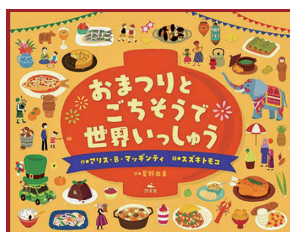
おまつりとごちそうで世界いっしょ アリス B マグンティ/作(汐文社)

「秋田のナマハゲ」の実物を見たことはないし「沖縄のパーントゥ」に泥だらけされたこともない。非日常の全国18カ所の祭りを取材した一冊。