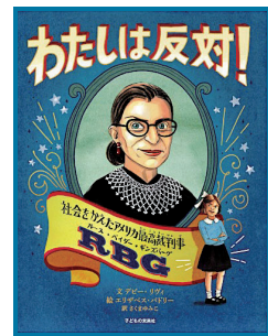
わたしは反対! デビ・リヴィ/文、エリザベス・パドロー/絵 (子どもの未来社)

自分の力を信じて道を切り開いた100人の女の子たちの物語。彼女たちを現代の女性アーティスト60人が描く肖像画とともに名言を添えて紹介。