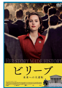
DVD ビリーブ 未来への大逆転 ミミ・レダー/監督、フェリシティ・ジョンズ/主演 (平成30年/アメリカ映画)

時代遅れの考えや、不公平・不平等に「私は反対」と声を上げ続け、社会に変化を起こしていったルース・ペイダー・ギンズバークの伝記。