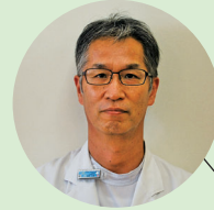
今月のコラムは 放射線科医監 坂口 俊也 がお届けします