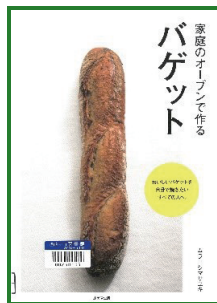
家庭のオープンで作るバゲット ムラヨシマサユキ/著 (成美堂出版)

ミニ食パンやバターロールなどの定番からピザパンも作れる入門書のような一冊。きび砂糖を使うことで柔らかい風味のパンが出来上がります。