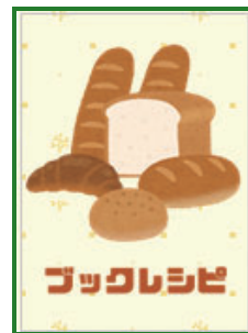
司書がすすめる図書リスト 今月のブックレシピ

関西はパン激戦区。個性的なパン屋があちこちにあり、少し遠出をして、パン屋を巡って楽しみませんか。