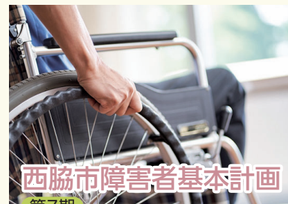
西脇市障害者基本計画