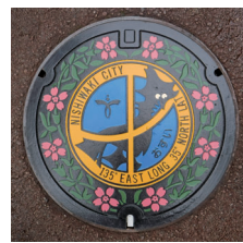
西脇市のデザインマンホール