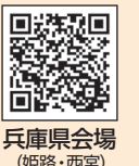
兵庫県会場（姫路・西宮）