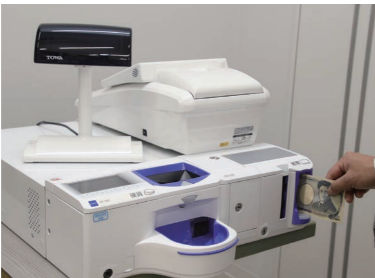
▲現金自動精算機も導入し、新しい生活様式を採用