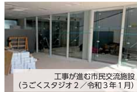
工事が進む市民交流施設 (うごくスタジオ2/令和3年1月)

「つながり」をテーマとした市役所新庁舎・市民交流施設オリナスが、5月6日(木)にオープンします。特に現在の西脇市民会館に代わる「市民交流施設」は、健康・地域・観光を軸とした交流機能を有します。同施設では、西脇市が目指す「健康」をキーワードとしたまちづくりを進めるための健康増進活動のほか、文化芸術活動をはじめとする多様な市民活動ができ、市民の皆さんが日常的に訪れたい「交流の場」となることを目指します。 また、同施設の運営には指定管理者制度を導入。この制度は民間事業者が行政に代わって公の施設を管理運営するもので、その豊富なノウハウを生かしながら、施設を効果的・効率的に管理していきます。そして、利用者のニーズに応え、より良いサービスを提供します。 2月からは施設内のホールや諸室の利用予約の受け付けを開始。そこで今月号では、市民の皆さんが気軽に利用できるホール・各諸室を紹介します。