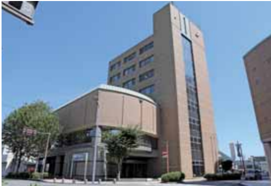
▲西脇商工会議所が入る西脇経済センタービル