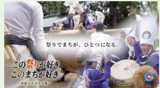
▲祭りの約2週間前から密着。ひたむきに頑張る人々の姿を捉えた動画