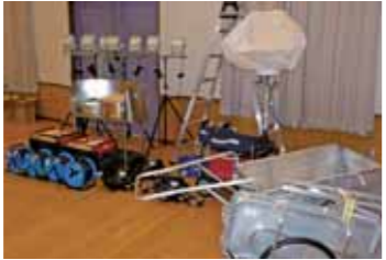
▲新たに整備された資機材

この助成事業は宝く じの受託事業収入を財 源としており、地域社 会の健全な発展と住民 福祉の向上を図るこ とを目的に実施されて います。