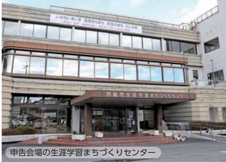
申告会場の生涯学習まちづくりセンター

※会場はいずれも生涯学習まちづくりセンター1階です。 ※申告期間前半と午前中は、例年大変混み合い、待ち時間が長くなります。あらかじめご了承ください。