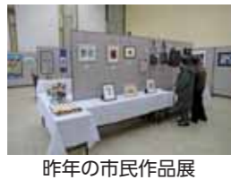
昨年の市民作品展

経済産業省キャッシュレス推進室の講師が、ポイント還元制度等について解説します。 ▼とき 2月12日(水)午後