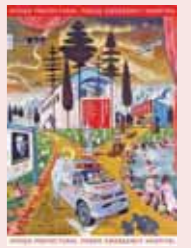
ポスター(デザイン:横尾忠則)

◆とき 2月1日(土)～5月10日(日) ◆ところ 横尾忠則現代美術館(神戸市) ◆開館時間 午前10時～午後6時(金・土曜日は午後8時まで。入館は閉館の30分前まで) ◆休館日 月曜日(2月24日、5月4日は開館。なお、2月25日、5月7日は休館) ◆観覧料 一般=700円、大学生=550円、70歳以上=350円、高校生以下=無料(その他障害者割引等あり) ◆問合せ 横尾忠則現代美術館(☎078-855-5607)