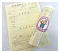
▲にしわき安心ボトル

◆その他 すすでにお持ちの方で緊急連絡先等の内容に変更があれば書き換えてください