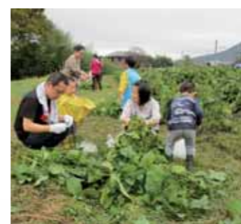
家族そろって枝豆の収穫体験に参加

さまざまな体験学習をしています。きょうだいも一緒に参加できるのが、休日版教室のいいところです。また、地区や年齢を越えて多くの仲間と交流できることも、この教室の魅力です。参加者からは、「仕事をしているときできないことが、みんなと楽しく体験できるのでうれしい」「家ではできないことを子どもにも体験させてあげられる」「いろいろな方と話ができて、情報交換や友達が