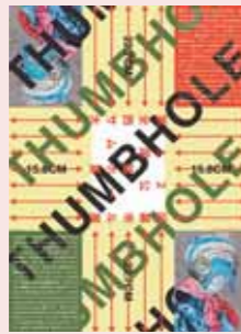
▲横尾忠則さんがデザ インのサムホールポ スター

ゴルフ大会等の開催による会 員の健康保持および福祉施設 等への友愛活動等、老人クラ ブ活動の推進に尽力