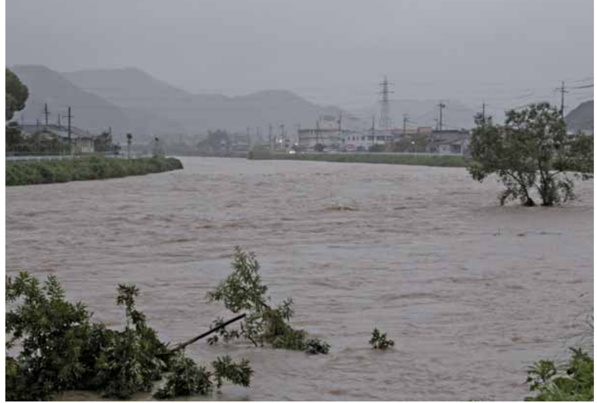
平成30年7月豪雨で増水し、川岸の木が浸かった杉原川（平成30年7月7日／郷瀬町）

大雨や台風が多発する季節を迎えました。昨年の「平成30年7月豪雨」では、西脇市に初めて大雨特別警報が発表。また、加古川や杉原川が増水し、市は10,299世帯、24,841人に避難勧告を発令しました。毎年多発する豪雨災害から命を守るため、新たな防災情報の発信が始まります。 ◆問合せ 防災安全課（市役所内線394）