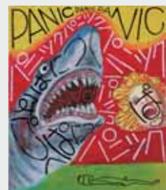
ポスター (デザイン=横尾忠則)

▼とき 6月27日(木) 午前 10時30分~午後2時(事前予 約制) ▼ところ 市民会館第 1会議室 ▼受付期間 6月3 日(月)~26日(水)(土・日 を除く) ▼定員 14名(定員 になり次第締め切ります) ▼ 相談内容 年金(老齢・障害 ・遺族)請求、その他年金に 関する相談(代理相談は委任 状必要) ▼持ち物 年金手帳、 障害者手帳、印鑑など(請求 手続きに必要なものは事前に お問い合わせください) ▼申 込・問合せ 加古川年金事務 所 お客様相談室(☎0791 427-4740)