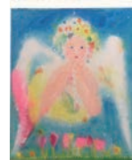
作：寺門孝之 SPRING HAS COME