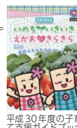
平成30年度の子育て支援ガイドブック

お問い合わせください。 ◆問合せ 子育て支援課(市役所内線375) 株式会社サイネックス姫路支店(☎079-222-7630)