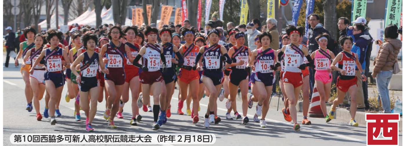
第10回西脇多可新人高校駅伝競走大会（昨年2月18日）

* * * * * メール配信サービスは定時の行政情報をお届けすることを目的としています。気象情報や火災情報などの緊急情報は「にしわき防災ネット」をご利用ください。登録方法は今月号の31ページに掲載しています。