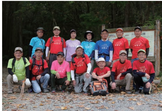
安全で快適な登山道を守り続ける 矢筈山の会の皆さん

地元の山の素晴らしさを伝えたい 矢筈山は高田井町から市原町、野村町緑風台などにつながる標高363メートルの山です。この山で自身も登山を楽しみながら、他の登山者のために山道整備を行うのが、「矢筈山の会」の皆さんです。 * * * 矢筈山は平成20年、高田井町から山頂までの登山道が県によって整備されました。その後、地元の山を愛する住民数名が道の端にロープを張ったり、坂道に階段を設置したりして、市原町や野村町緑風台への縦走路を開き、これが