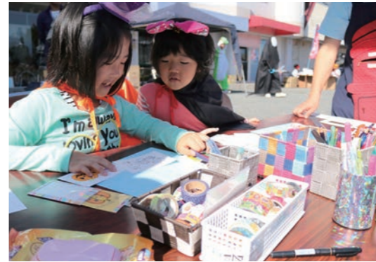
しばざくら通り商店街(野村町)のイベントで仮装をしてワークショップを楽しむ子どもたち