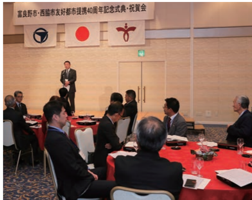
式典・祝賀会に合わせて富良野市から北猛俊市長や市議会議員団、市民訪問団が来西

本市と北海道のへそ・北海道富良野市が友好都市親善協定締結40周年を記念し、式典と祝賀会を開催。出席した片山市長や富良野市の北猛俊市長をはじめ、両市の市議会議員や市民訪問団などの関係者が、へそが取り持つ友好の絆を確かめ合い、両市の末永い交流とさらなる発展を誓いました。