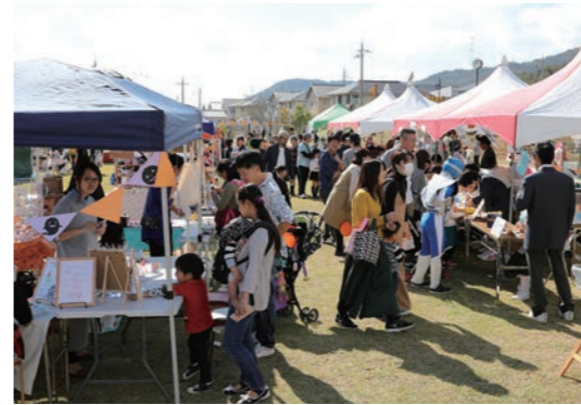
茜が丘複合施設みらいえでの「みらフェス」

「自遊空間きららハッピーハロウィン」（上野・下戸地区商店街周辺）や「セントラルカーニバル」（コミュニティセンター西脇区会館周辺）では仮装コンテストや各種ステージイベントを実施。しばざくら通り商店街では商品を100円で販売する「100えん商店街」もありました。