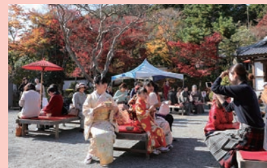
西脇市文化連盟が紅葉をめながら茶席を楽しむ催し「照楓会」を開催し、3団体が民謡や舞踊などの芸能を発表。北播スケッチ大会や短歌会も開かれました。(11月18日、西林寺)