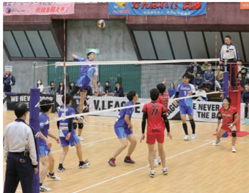
選手のスピードあふれるプレーに観客席から拍手と歓声が沸く

プロバレーボールVリーグ男子3部で、本市を第2の活動拠点とする「兵庫デルファイノ」の主催試合が行われ、熱戦が繰り広げられました。県内で唯一Vリーグに所属する同チームは、昨年からは本市を第2の活動拠点としており、9月には選手らが小中学生を指導するバレーボール教室を開催しました。