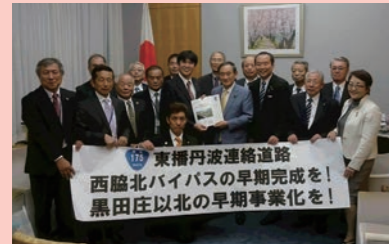
片山市長や国道175号沿線の関係者が菅義偉内閣官房長官らを訪問。国道175号西脇北バイパスの早期完成と、黒田庄以北の早期事業化を要望しました。(10月15日、首相官邸など)