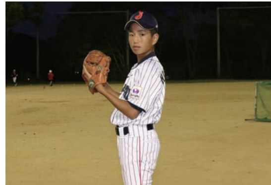
軟式野球アジア大会で強豪国相手に奮闘 兵庫教育大学附属小学校6年