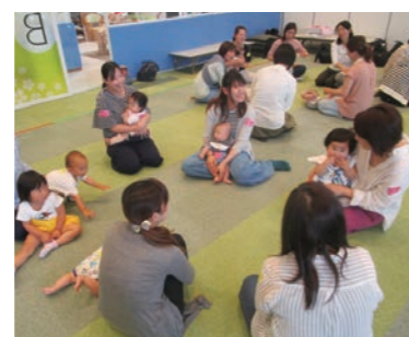
ベビーのつどいで楽しく交流する親子

また、今年度出産予定の方を対象に、母になる前という意味の「プレママ」の教室もできました。参加者は、妊娠や出産などに対する不安を教室の仲間と共有することで、