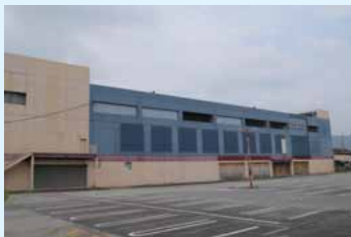
▲旧カナー特西脇建物

工事の進ちょく状況については、広報にしわきや市ホームページなどで随時お知らせします。