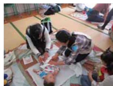
協力しながらオムツ交換に挑戦

こどもプラザでは、このような学びの事業の実施を大切にしています。子育て中の保護者の方が多い方とつながって安心して子育てができるよう、さまざまな角度から支援をしていきたいと思っております。本年もどうぞよろしくお願ひします。