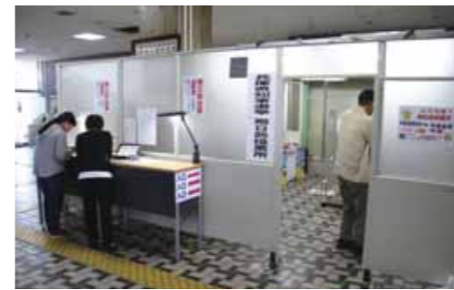
▲期日前投票所は市役所1階に設置しています。

◆投票所入場券 投票所入場券は公示または告示日以降に郵送します。入場券は投票の棄権防止や投票所の確認、整理などのために発行するものです。入場券がなくても投票できます。