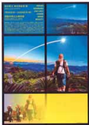
企画展ポスター(デザイン:横尾忠則)

コンピュータを用いてアート作品を生み出す国際的パイオニア・アーティスト幸村真佐男の1960年代のグラフィックアートや、太陽の光跡を追い求め、さまざまな国で撮影した写真の最新作等を展示します。