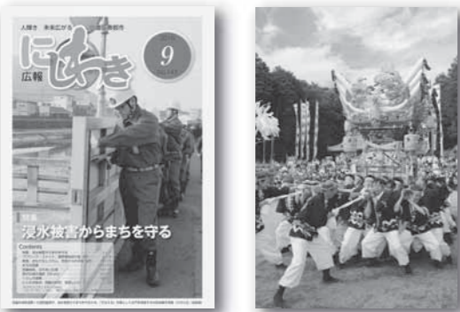
広報紙の部 一枚写真の部

第64回兵庫県広報コンクール「広報紙の部」で、『地域で取り組む総合治水』を特集した広報にしわき平成28年9月号が努力賞、「一枚写真の部」で平成28年11月号表紙に使用した写真が努力賞を受賞しました。引き続き市民の皆さまに親しまれる広報紙づくりに努めてまいりますので、ご愛読よろしくをお願いします(広報担当)。