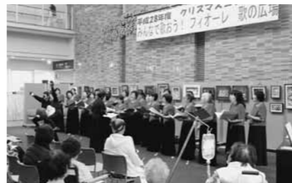
女声コーラスファイオーレは多可町中区在住のメンバー中心の35名で構成されているコーラスグループです

西脇病院では、入院、外来患者さんを対象に「癒し」を目的として定期的に院内でコンサートを開催しています。先月14日には、女声コーラスファイオーレによるクリスマスコンサートを開催。童謡メロデーやクリスマスソングなどの名曲を披露いただきました。