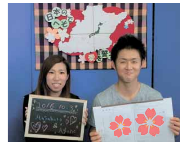
▲バックボード背景の播州織は、季節によって変化します。

記念撮影を希望される方はカメラやスマートフォンをご持参の上、職員にお声がけください。