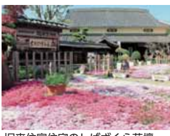
旧来住家住宅のしばざくら花壇

市では、市花しばざくらを公共の場に植栽してくださる方に、苗や防草シートなどを無償で提供しています。ご希望の方は環境課窓口までご相談ください。