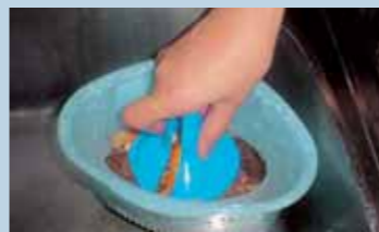
▲三角コーナーの水切り

ごみの収集運搬や焼却に必要なエネルギーを減らすためにも、生ごみの水切りにご協力ください。