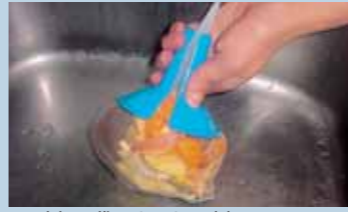
▲水切り袋・ネットの水切り