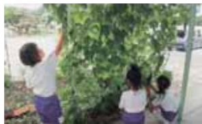
比延幼稚園の「緑のカーテン」

ゴーヤやアサガオなどのツル性植物で「緑のカーテン」を育て、日射を遮りながら自然の力を生かして涼しく過ごしませんか。きれいな花やおいしい実を楽しみながら、エアコンの使用量を減らすことができます。身近なエコを始めてみましょう。