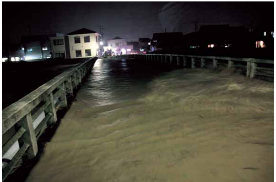
平成 23 年 9 月 4 日未明撮影。増水した杉原川・由縁橋（西脇）

「平成26年8月豪雨による広島市の土砂災害」や「平成27年9月関東・東北豪雨」、4月には「平成28年熊本地震」など、近年、大規模な自然災害が全国各地で発生し、多くの尊い命が失われています。西脇市においても、「平成16年台風23号」により、甚大な被害を受けました。6月になり本格的な梅雨の時期を迎えます。災害から身を守るためには、日ごろの備えと早めの避難が最も重要です。市では、早めの避難行動に対応するため、「自主避難所」の開設を行っています。